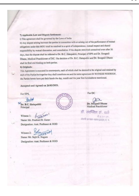
E-Waste Management MOU

Mobile No. (WhatsApp): +91 9423879885 • Email: info@iip.ind.in • Website: www.iip.ind.in