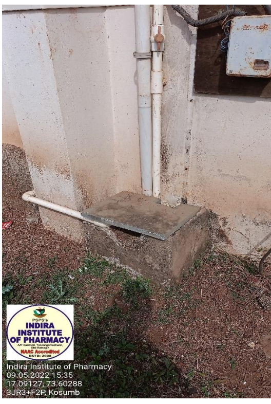
Liquid Waste Management-Land Filling